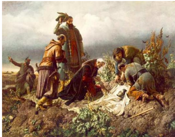
II. Lajos holttestének fellelése

Ami Magyarország állapotát és kormányzatát illeti, megegyeztünk és elhatároztuk, hogy mindenik közülünk az ország s a neki alávetett tartományok ama részét, amelyet most tényleg bír, szabadon, a királyi hatalom teljességével bírja és birtokolja ... Minthogy pedig felséges János királynak most sem felesége, sem gyermekei nincsenek, ha Isten kiszólitáná ez árnyékvilágból, ... beleegyezett abba, hogy halála után, még ha volna is fia, az egész magyar birodalom összes országaival, tartományaival s alávetett részeivel s a királyi jog egész teljességével mi reánk, vagy ha mi időközben meghalnánk, fiunkra szálljon és maradjon, akit az ország köteles lesz közös megegyezéssel királlyá választani, és ha az is elhalna, az ő törvényes s a fiaitól vagy azoknak törvényes örököseitől leszármazó örökösökre és utódokra és ha azok is kihalnának, a császár ő felségére s az ő fiaira és törvényes örököseire szálljon ... ( A váradi békéből, 1538 )